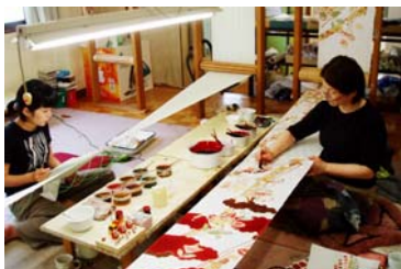
工房で着物セミオーダー