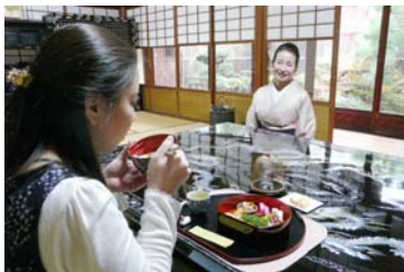
点心弁当付き京町家見学