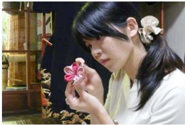
つまみ細工で髪飾り作り