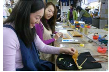
京友禅で半襟&和モダンバッグ作り