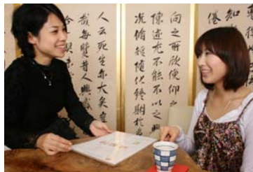
町家でアロママッサージ