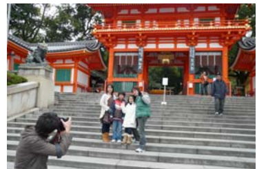
プロカメラマンの観光撮影プラン