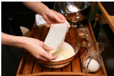
生湯葉パック&フットケアエステ