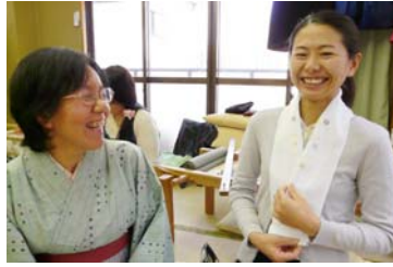
京刺繍で半襟作り