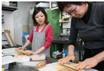
おぼんざい料理レッスン