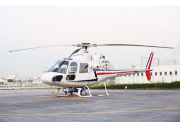
ヘリコプターの遊覧飛行