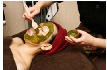
お抹茶パックエステ