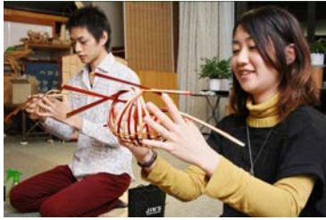
和モダン竹かご作り